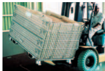
フォークガイド内袋付