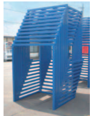
▲ネスタイング状態