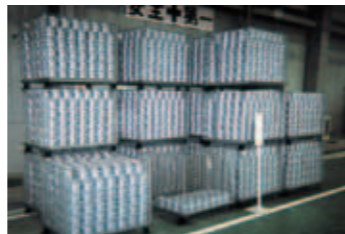
▶ アルミダイキャストメーカー