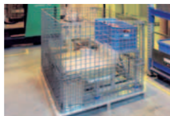
パレットサークル