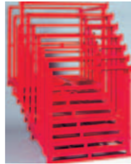
▲ネスタイング状態