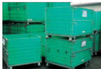
キャスター・ダンブラ張り