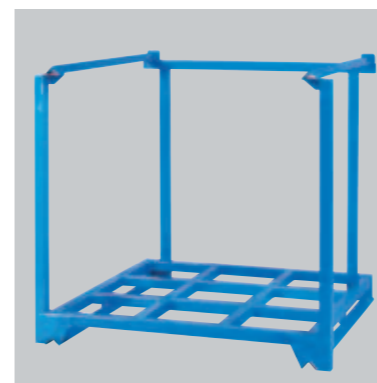
正テナー (受注生産品)