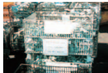
▶ プレス部品メーカー