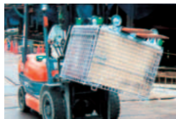
フォークガイド・キャスター付