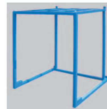
逆テナー (受注生産品)